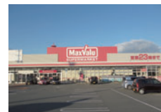
マックスバリュ郷津店 約100m