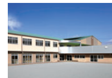
まつさか幼稚園 約750m

[郷津5期概要] ●所在地/三重県松阪市郷津町 ●交通/JR・近鉄松阪駅1500m ●総区画数/17区画 ●地目/宅地 ●用途地域/第二種住居地域 ●建ぺい率・容積率/60%・200% ●学校区/第四小学校・鎌田中学校 ●開発許可番号/松阪市開発 第KK15040029号 ●道路幅員/6mアスファルト舗装(松阪市) ●施設・設備/電気:中部電力 水道:松阪市上水道 汚水:公共下水 ガス:都市ガス 雑排水:公共下水 雨水:前面道路側溝