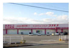
ドラッグコスモス郷津店 約400m