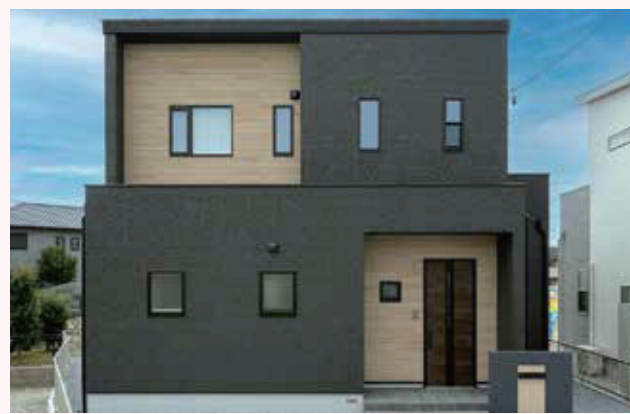
パナソニックで「一番人気の「ラクシーナキッチン」」搭載

【1階/2階 床面積】60.45㎡/52.17㎡ 【延べ床面積】112.62㎡(34.06坪) 【土地面積】194.18㎡(58.73坪)