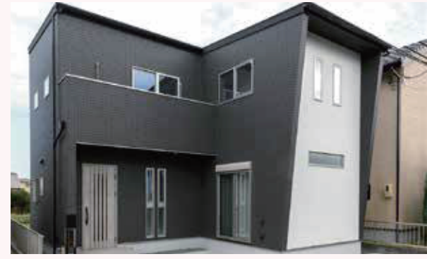
子ども達がのびのびと暮らせる広いLDKが魅力