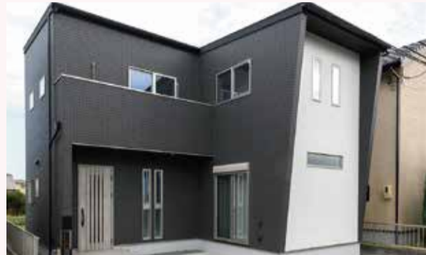
子ども達がのびのびと暮らせる広いLDKが魅力