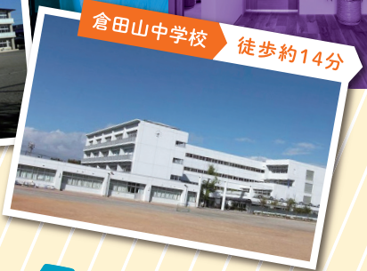
倉田山中学校 徒歩約14分