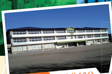
有絹小学校 徒歩約10分