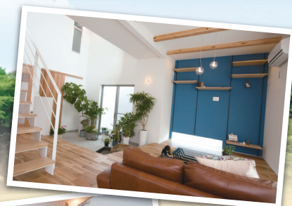
※写真は同分譲地内の別の完成住宅です