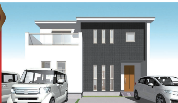
パナソニック ハイグレード仕様