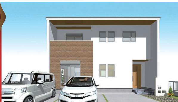
パナソニック ハイグレード仕様